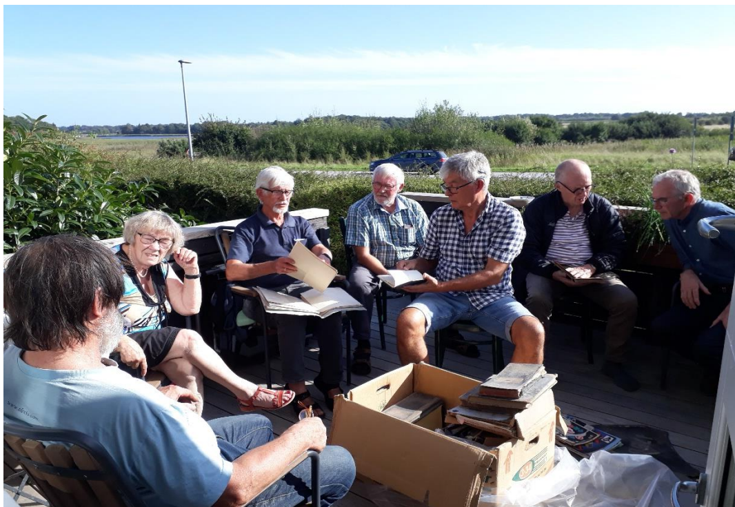
Bestyrelsesmøde i det fri