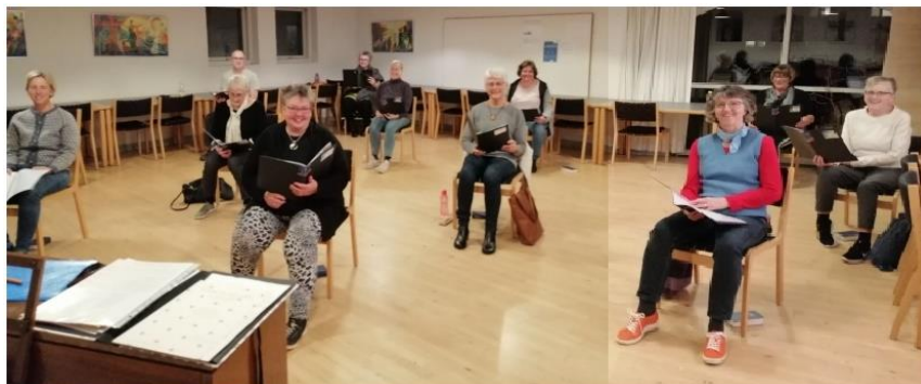
Projektkor: sammensat af 2 fotos

Jeg er så heldig at have mulighed for at være med i dette projektkor, og det er en sand fornøjelse at deltage.