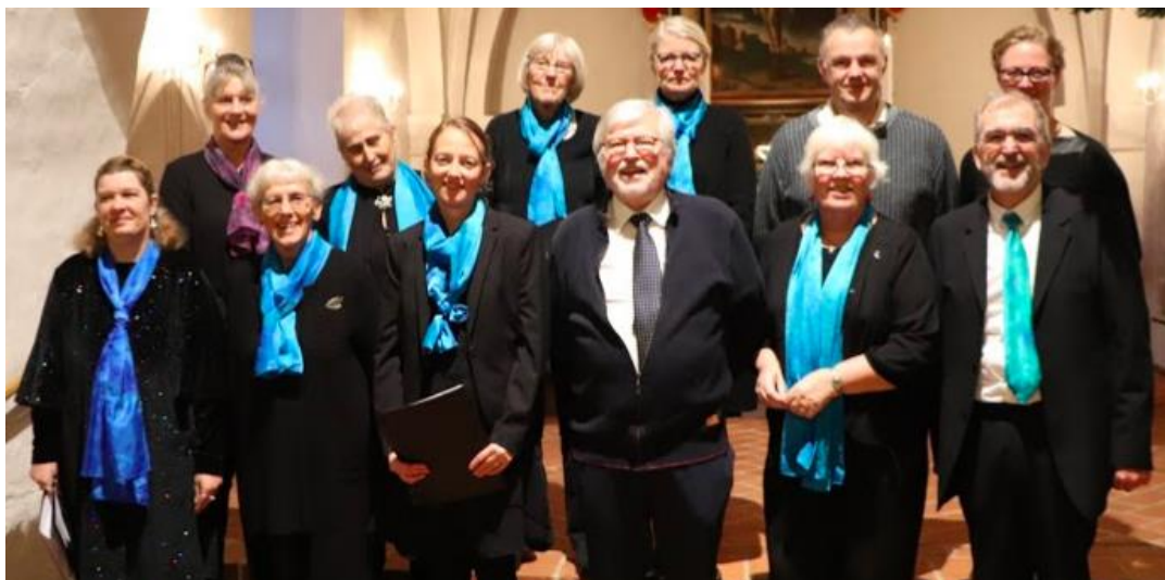
Ad Hoc Koret til De 9 Læsninger 1. søndag i advent 2018 i Vonsbæk kirke