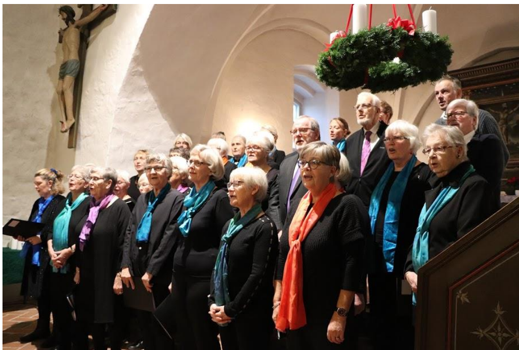
Seniorkor og Ad Hoc Kor ved De 9 Læsninger 1. søndag i advent 2018 i Vonsbæk kirke