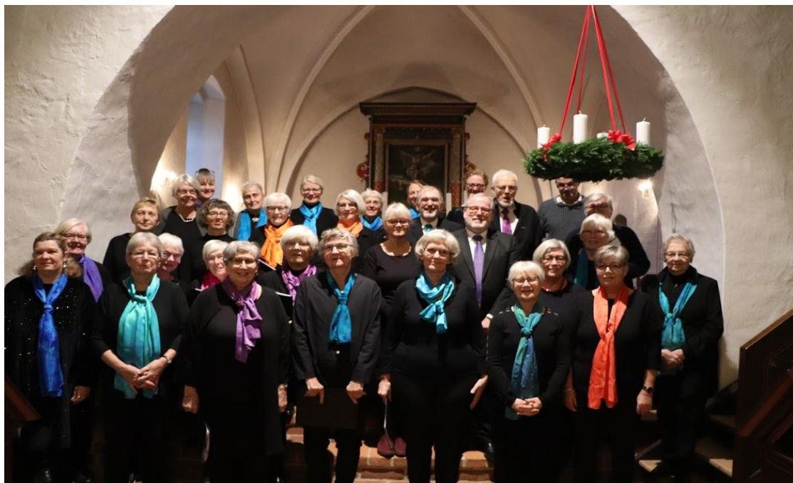
Senior- og Ad Hoc Kor til Syng Julen Ind i Vonsbæk kirke 2018.